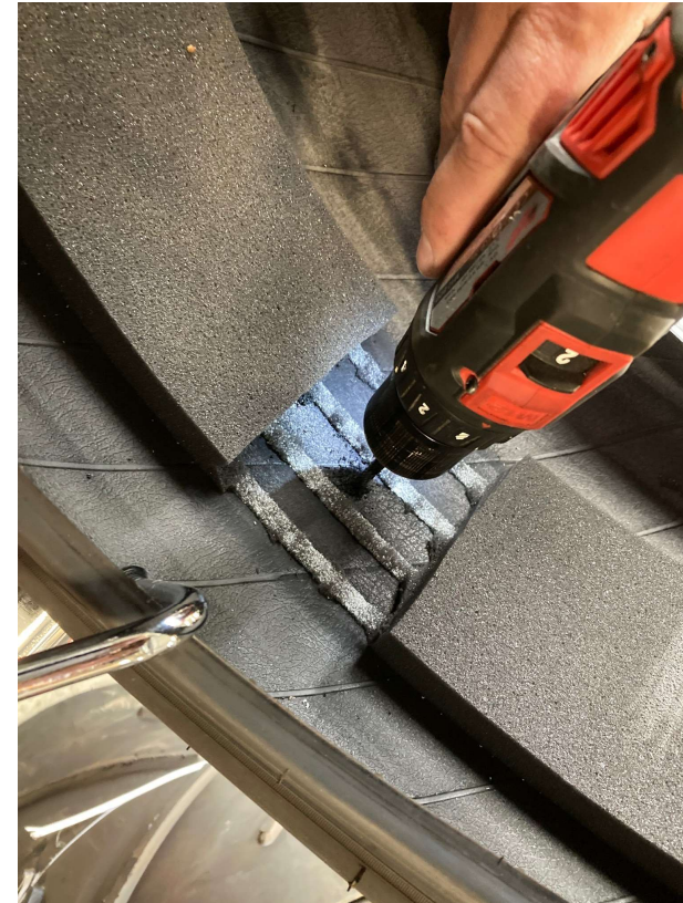
Skadeskanalen skadesbegrænses med fræser.