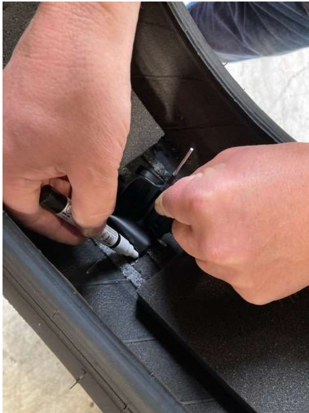
Skadesstedet markeres med "Repair Marker".