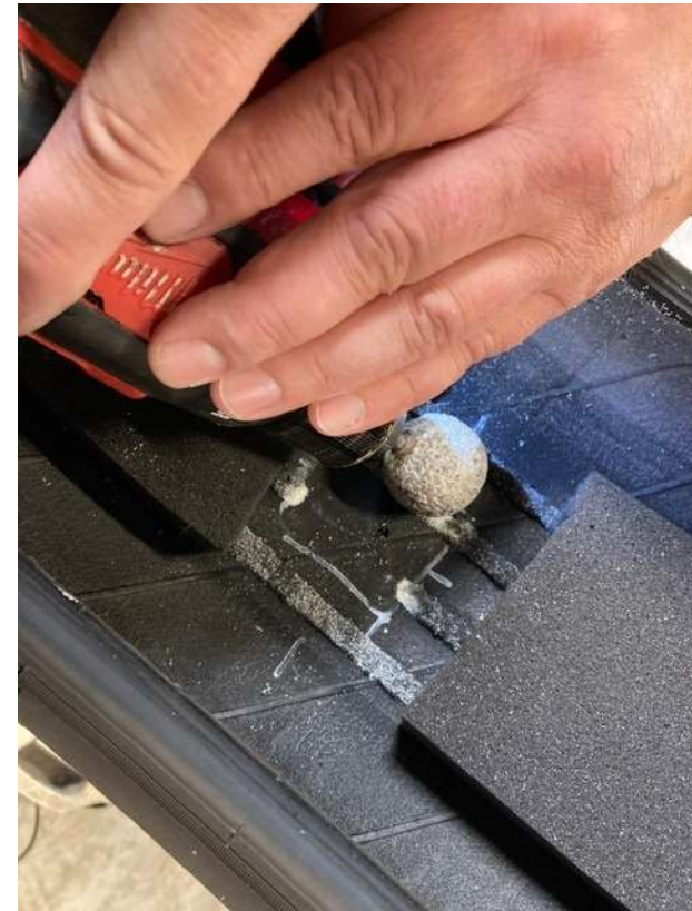
Skadesstedet raspes med egnet "Koral-Sten" Fjern først limresterne.