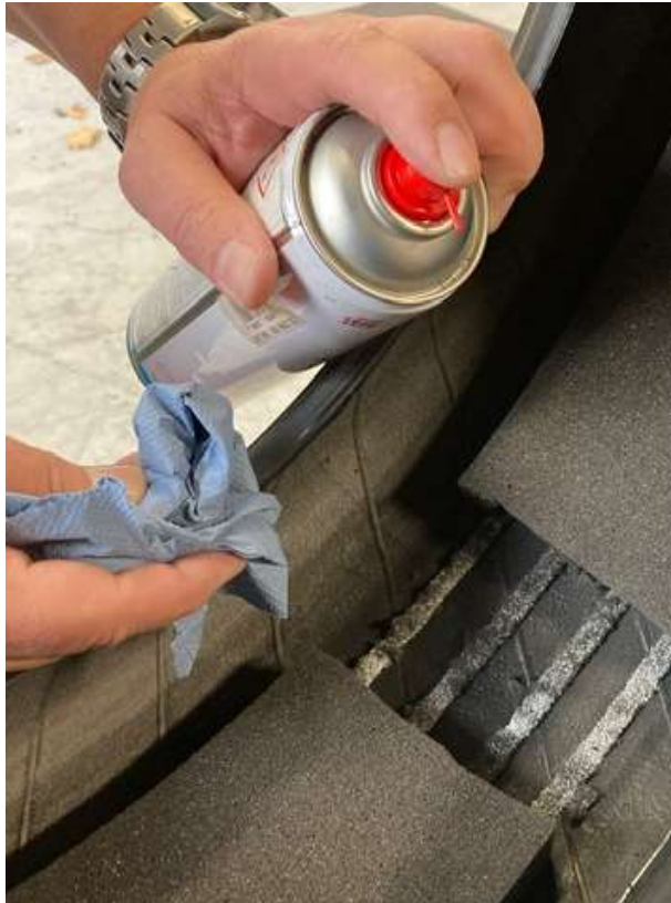
Skadesstedet renses med Liquid Buffer.