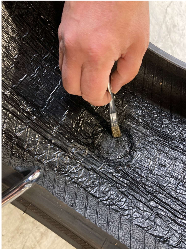
Hele den raspede overflade indsmøres med BL cement.