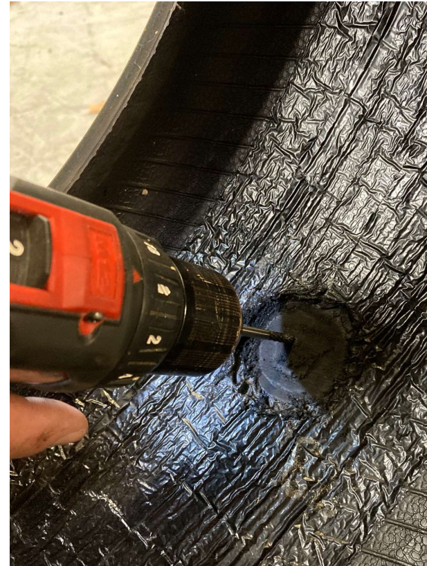
Først nu skadesbegrænses skadeskanalen med fræser.