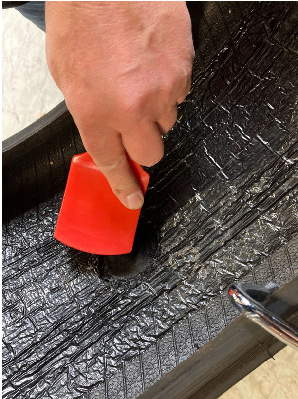
Overfladen børstes ren for raspestøv.