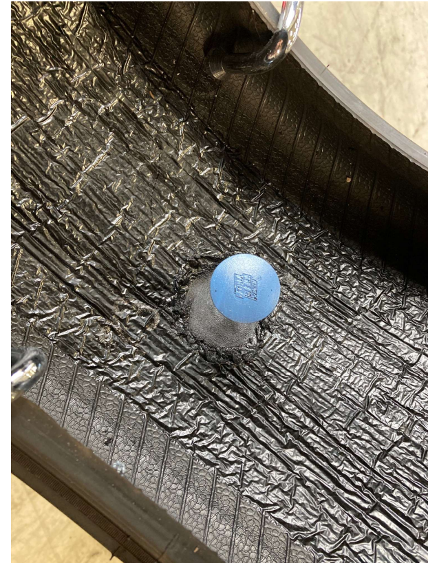
Når cementen er tør monteres den valgte Combi Lap.