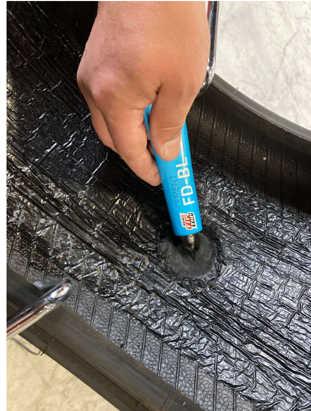
Kom et par dråber BL cement igennem skadeskanalen.