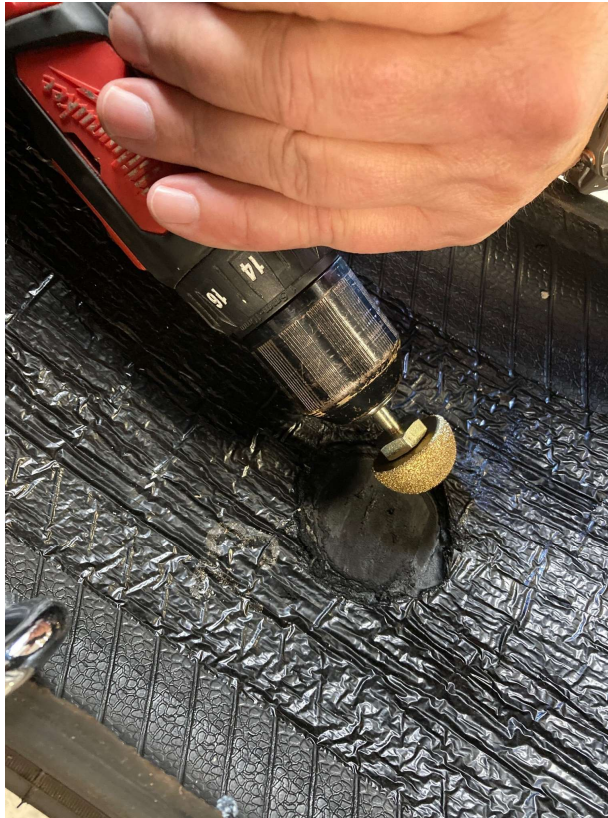
Innerlineren raspes ren.