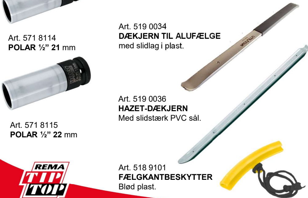
Art. 519 0034 DÆKJERN TIL ALUFÆLGE med slidlag i plast.

LANGE NEDDREJEDE 1/2" KRAFTTOPPE FRA POLAR MED PLASTBESKYTTER