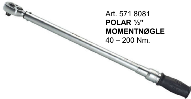
Art. 571 8081 POLAR 1/2" MOMENTNØGLE 40 – 200 Nm.

LANGE NEDDREJEDE 1/2" KRAFTTOPPE FRA POLAR MED PLASTBESKYTTER