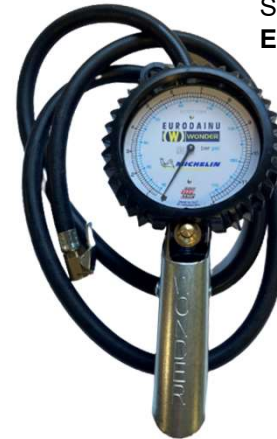
Art. 519 1930 MICHELIN DAINU PUMPEUR 12 BAR Skala i Bar og PSI EN12645 GODKENDT