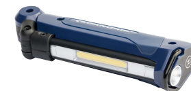
Art. 571 9543 LED 3-i-1 Arbejdslampe MINISLIM 200 lumen Magnetisk L: 132 mm H: 30 mm B: 41 mm