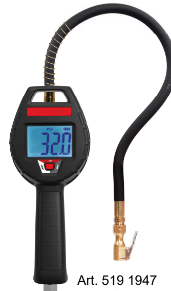
Art. 519 1947 JP DIGITAL PUMPEUR Skala i Bar-PSI-KPa Stort "Air-Flow" EN12645 GODKENDT