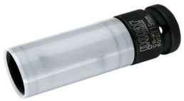
Art. 571 8110 POLAR 1/2" 17 mm