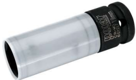
Art. 571 8112 POLAR 1/2" 19 mm