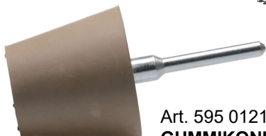
Art. 595 0121 GUMMIKONUS FOR LIMRESTER