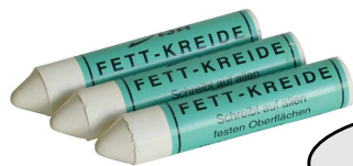
Art. 595 0131 SISA KRIDT HVID