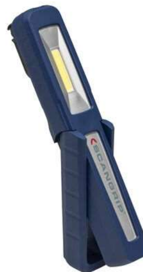
Art. 571 9540 LED 2-i-1 Arbejdslampe COB 150 lumen Magnetisk L: 155 mm H: 21 mm B: 27 mm